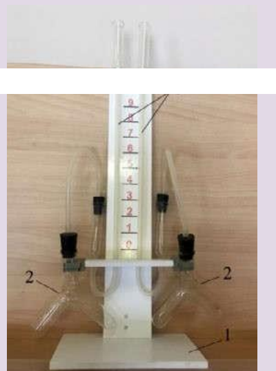
Рис. 4. Прибор для демонстрации зависимости скорости химических реакций от различных факторов: 1 — подставка; 2 — сосуды Ландольта; 3 — манометрические трубки

соединяются с сосудами Ландольта с помощью пластиковой трубки с пробками (рис. 5). Между манометрическими трубками на панели нанесена шкала для наблюдения уровня жидкости в трубках. Окрашенной жидкостью может быть раствор любого красителя в воде.