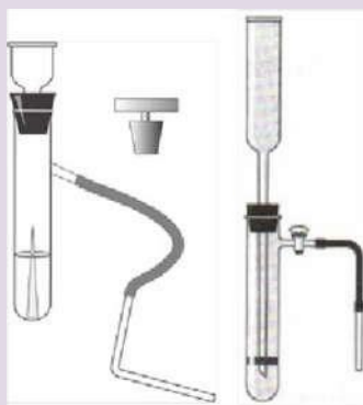
Рис. 7. Прибор для получения и собиария газов

Прибор для получения газов используется для получения небольших количеств газов: водорода, кислорода (из пероксида водорода), углекислого газа.